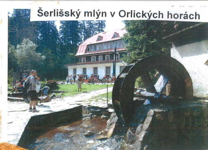
Šerlišský mlýn v Orlických horách