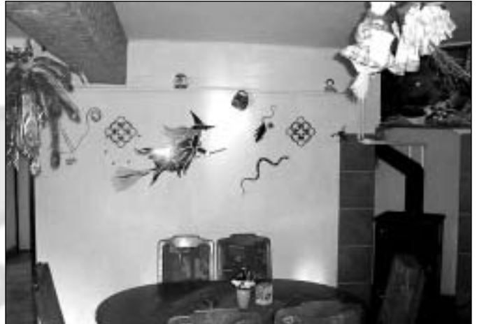
Aktivní hospůdka „U Čarodějnic“ ve Vajglově

kapelu Tuty-Fruty, je tu ještě živěji. V této hospůdce si můžete kromě běžného sortimentu nápojů objednat jednoduché menu - hamburgery, bramboráčky, hranolky, také zmrzlinové poháry. Ti, kteří by si zde chtěli zařídit rodinnou oslavu, banket apod., si mohou domluvit slavnostnější