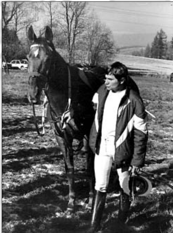
Foto z 5. 11. 1988, kdy přijal pozvání k účasti na Hubertově jízdě tehdy již dvojnásobný vítěz Velké pardubické Josef Váňa se slavným Železníkem

anglického, který zdůrazňuje sportovní vyžití. Lišku nyní představuje jezdec s liščími ohonem připevněným na rameni, který se vydává první na trasu do terénu. Následují ho jezdci a koně s masterem v čele. Zdatnější jedou těžší trasu s přírodními a umělými překážkami, členitějším terénem apod. Master je nejdůležitější osoba jízdy, zaznamenává prohřešky jezdců - pády, odmítnutí skoku, nejhorší prohřešek je předjetí mastera. Jízda má zhruba v polovině přestávku, během které se na vybrané louce všichni diváci, jezdci i koně občerství, případně u ohňů usuší, a pokračuje se dále. Celá jízda je ukončena závěrečným dostihem - Halali. Zde přichází ke slovu také „liška“, jezdec se zmíněným ohonem, za kterým se všichni vydávají a v plném trysku se ho snaží dostihnout a ohon ukořistit. Poslední hold sv. Hubertu je vzdán večer při zábavě, kdy je zahájen soud se všemi