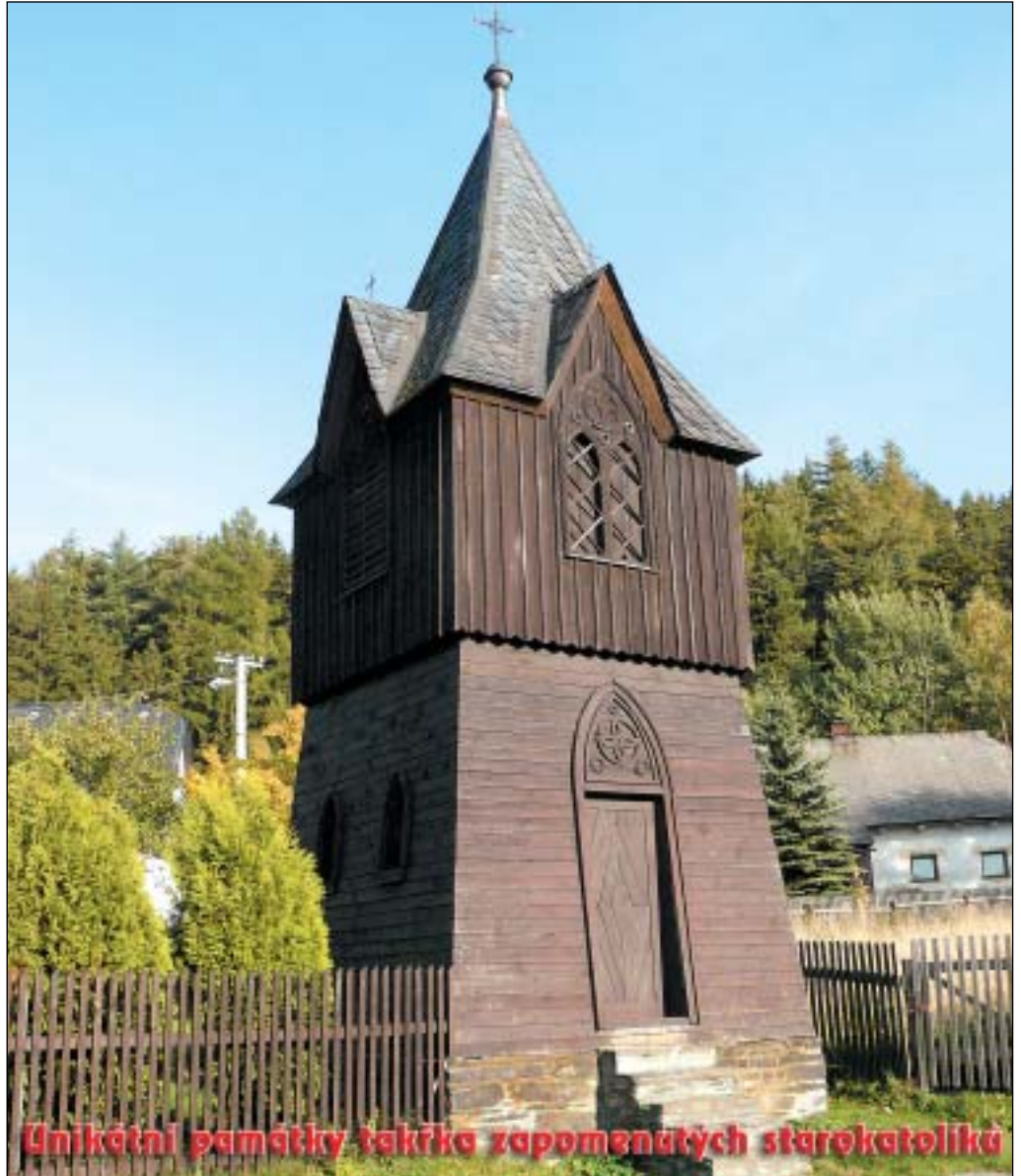
Unikátní památky takřka zapomenutých starokatolíků