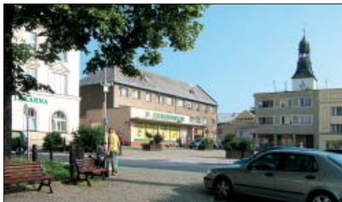
Prodejna CA&VA, 2007