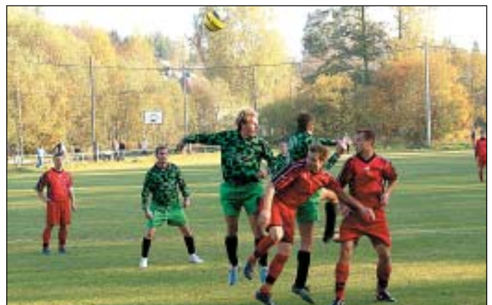
Břidličná si zajistila postup do krajského kola poté, co zvítězila nad Malou Morávkou vysoko 10:0