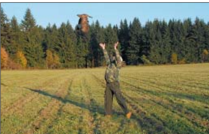
Záchranná stanice dravců ve Stránském dala svobodu dvěma ročním opeřencům - káněti a jestřábu lesnímu