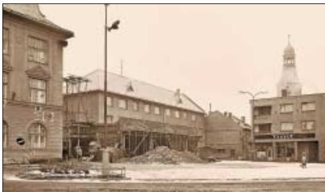
Stavba prodejny potravin na nám. Míru, 1969