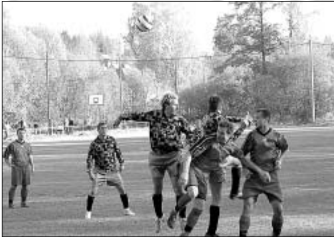
Finále okr. fotbalového poháru

soupeřem. Postup Břidličné do krajského kola je zasloužený. O branky se rozdělili: Patman 5, Holodňák 2, Calek, Fiury a Veselka po jedné. Na závěr převzali vítězové Pohár předsedy OFS z rukou jeho zástupců.