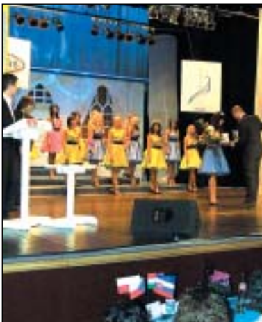
V Bruntále a Dolní Moravici byla zvolena královna krásy v Soutěži Superkrás pro rok 2007