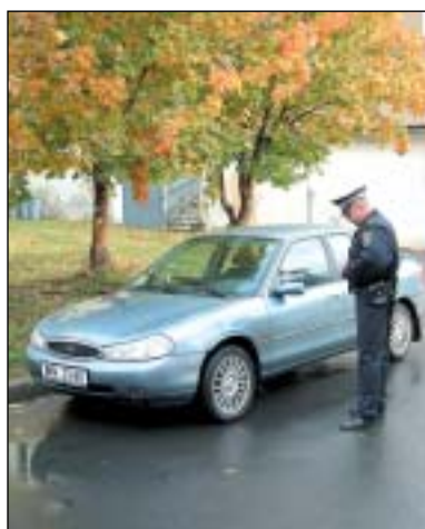
Vyhovuje početní stav dvou strážníků požadavkům, které jsou na ně kladeny?