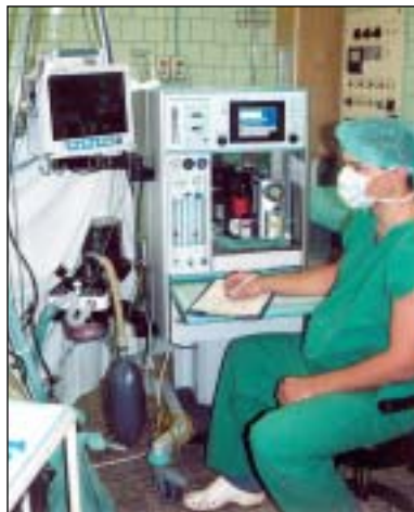
Nemocnice v Rýmařově má k dispozici špičkový anesteziologický přístroj.