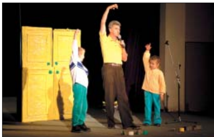
Moderátor televizní Kouzelné školky Michal Nesvadba probouzel v dětech fantazii a vytvořil skvělou atmosféru.