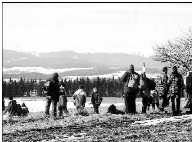
Čtyři desítky skautů na první jarní výpravě na kótu 700,4 m nad mořem (29.3.2003)

24.4. 1945 - Nacisté popravili v Těšíně desítky odbojářů, mezi nimi i pět ostravských skautů. Na jejich paměť roste od roku 1946 na hřebeni Ivančena v Beskydech kamenná mohyla. Každoročně při výročí jejich smrti k ní putují skauti, skautky, ale i trampové, aby položením svého kamene uctili jejich památku. Junáci Rýmařov