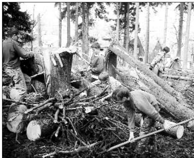
Skauti při odstraňování následků podzimní vichřice Na Stráni