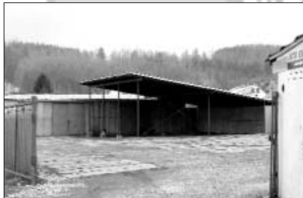
Bývalou sběrnou odpadů nedávno koupila soukromá firma. Budou zde stavebniny?

- byla dříve přijata řada drobnějších nesprávných rozhodnutí, jako např. smlouva o obhospodařování obecního lesa, která nás připravovala ročně cca o 500 tis. Kč, atd.