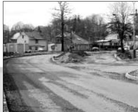
Rekonstrukce průjezdové komunikace a chodníků určitě změní vzhled Břidličné k lepšímu.