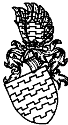
Erb pánů z Cimburka