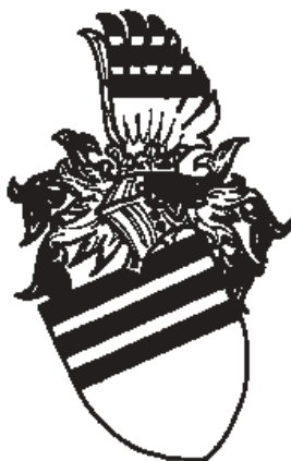
Erb pánů z Kunštátu