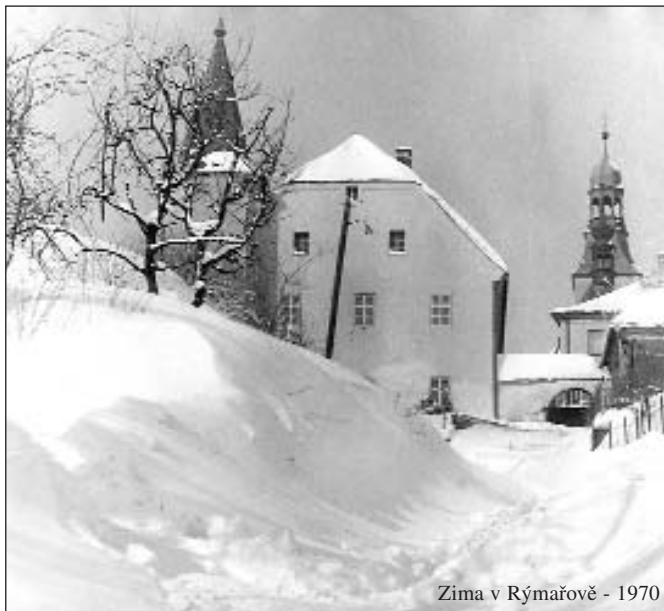
Zima v Rýmařově - 1970

ní situaci byla na okraji zájmů. Zastupitelstvo svým usnesením rozpočet města na rok 2003 schválilo, schválilo rovněž tvorbu a použití sociálního fondu na rok 2003 a finanční výhled na rok 2004 a pověřilo starostu města k jednání o přijetí úvěru na vyrovnání rozpočtového deficitu do výše 3,6 mil. Kč. (Stručnou rekapitulaci městského rozpočtu uvádíme formou přehledných tabulek v příloze uprostřed tohoto vydání.)