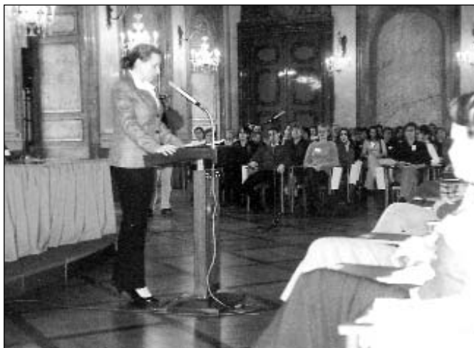
Paní ministryně Buzková při projevu na celostátní studentské konferenci v Senátu dne 27.1.2003