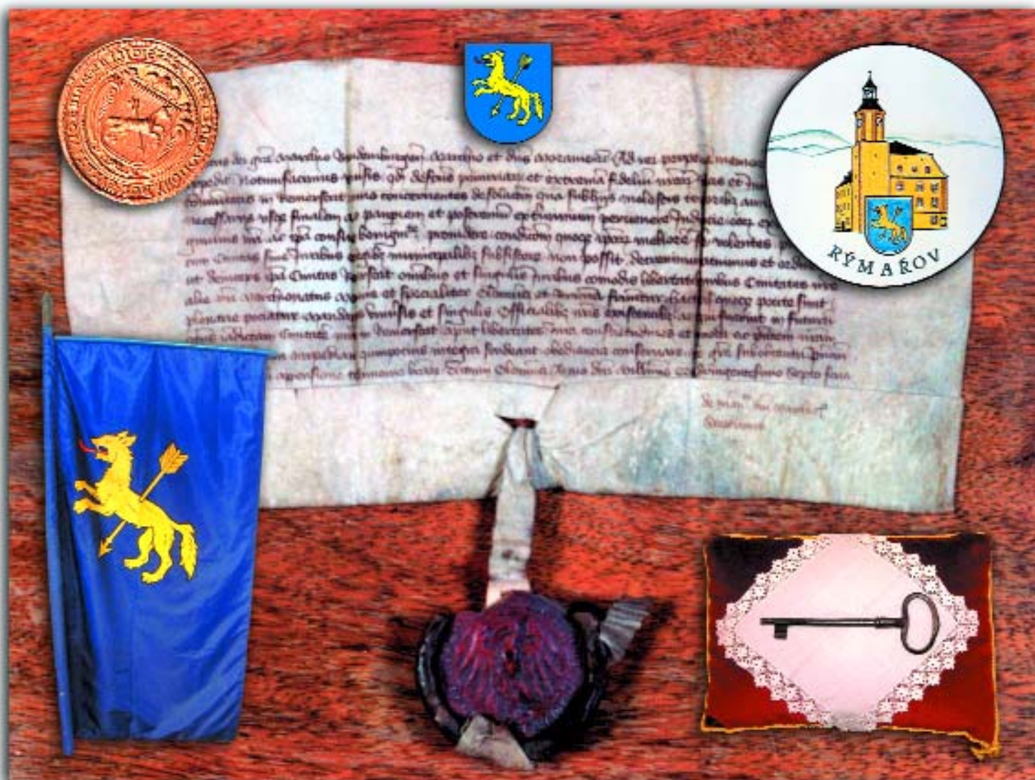
Symbyly města Rýmařova