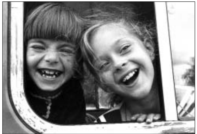
Jedna z vítězných fotografií Zdeňka Habra, Dětský úsměv