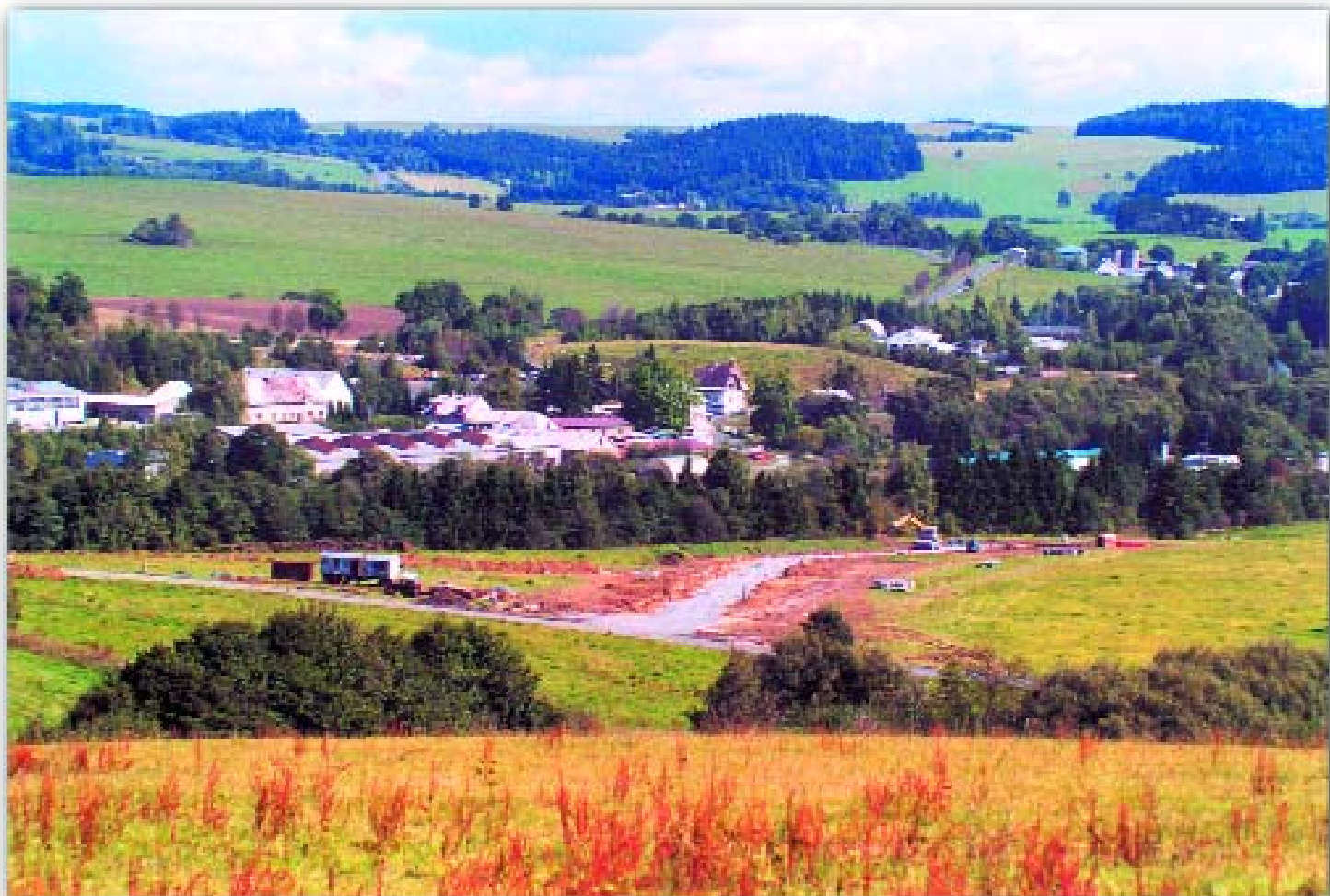
Průmyslová zóna města Rýmařova