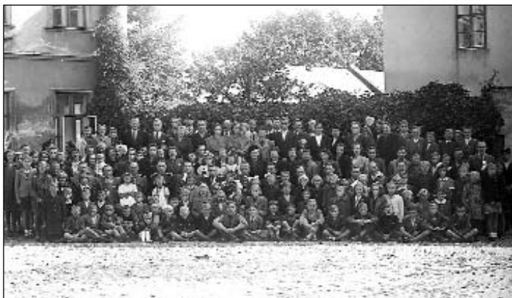
Zahájení školního roku 3.9.1945 v Rýmařově. Žáci, rodiče a učitelé na Kostelním náměstí.

Z materiálů kroniky ZŠ Jelínkova čerpal JiKo