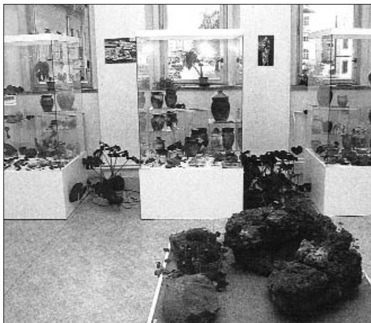
Expozice Městského muzea v Rýmařově.