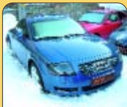
Audi TT Coupé 1.8, 1. majitel, 7 740 km, aut. klima, 4x airbag, ESP, ASR, ABS, CD, rádio, centrální, el. vybava a další. Cena: 695 000 Kč.