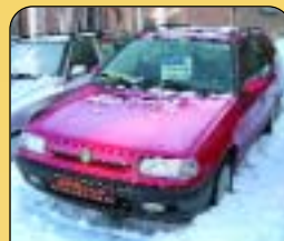
Škoda Felicia Combi 1.6 GLX, 55 kW, klima, r. v. 1997, 78 tis. km, CD, centrální, imobilizér. Cena: 118 900 Kč.