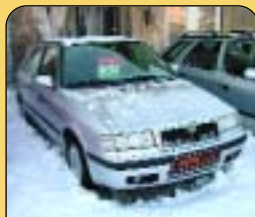
Škoda Felicia 1.3 GLXi LPG, 1. majitel, r. v. 1998, 86 900 km, rádio, centrální, imobilizér. Cena: 129 000 Kč.