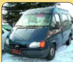
Ford Transit 2.5Di, 9 míst, r. v. 1998, 166 800 km, orig. rádio, imob., posil. říz., el. zrcátka. Cena: 268 900 Kč.