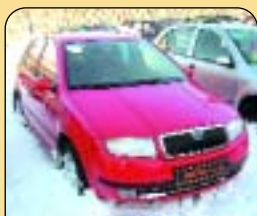
Škoda Fabia 1.9 TDi PD Comfort, 1. maj., r. v. 2000, 59 tis. km, 2x airbag, ASR, ABS, rádio, palub. poč., centrální a další. Cena: 219 000 Kč.