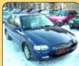
Ford Escort 1.8 16V klima, 1. maj., r. v. 1998, 78 tis. km, 2x airbag, ABS, CD, el. okna, posil. říz., centrální. Cena: 138 000 Kč.