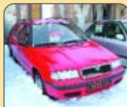
Škoda Felicia Combi LX 1.9 D, 47 kW, r. v. 1998, 92 tis. km, rádio, imobilizér, posilovač řízení, tažné. Cena: 129 500 Kč.