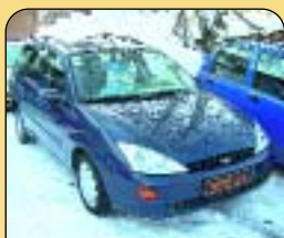
Ford Focus Combi 1.8 TDDi klima, 1. maj. r. v. 2001, 101 tis. km, 4x airbag, ABS, CD, centrální, el. okna a další. Cena: 259 000 Kč.