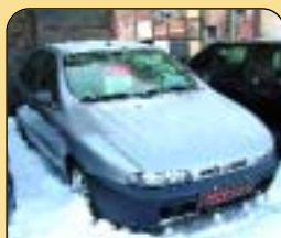
Fiat Brava 1.4 12V, r. v. 1996, 115 tis. km, airbag, CD, imobil., posil. řízení. Cena: 89 000 Kč.