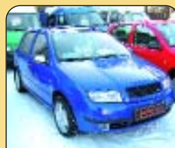
Škoda Fabia 1.4 MPi Classic 44 kW, r. v. 2000, 56 tis. km, airbag, rádio, centrální, imobilizér, posil. řízení. Cena: 179 000 Kč.