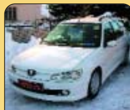
Peugeot 306 Combi 2.0 Hdí, klima, r. v. 2000, 97 tis. km, 4x airbag, rádio, imob., el. okna, posil. říz., centrální. Cena: 198 000 Kč.