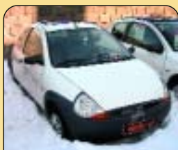
Ford Ka 1.3 37 kW, 3 dvěř., r. v. 1998, 118 tis. km, 2x airbag, ABS, rádio, imobilizér. Cena: 69 900 Kč.