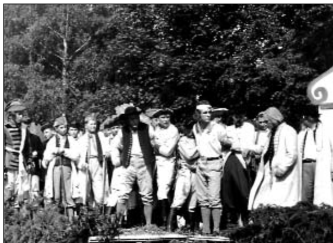
Divadelní hra Psohlavci, divadlo v přírodě (r. 1956)

U příležitosti 60. výročí divadla Mahen jsme pro vás přichystali ojedinelou výstavu fotografií pod názvem Historie a současnost Amatérského divadelního spolku Mahen 1945 - 2005.