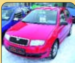
Škoda Fabia 1.4 MPi 44 kW, r. v. 1998, 99 500 km, airbag, CD, rádio, imob., posil. říz., centrální. Cena: 159 000 Kč.