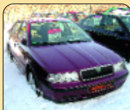
Škoda Octavia 1.8 20V SLX, 1. maj., r. v. 1997, 54 tis. km, 2x airbag, ABS, rádio, centrální, el. vybava, posilovač řízení a další. Cena: 179 000 Kč.