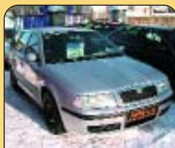
Škoda Octavia Combi 1.9TDi Eleg., klima, r. v. 2000, 142 tis. km, 2x airbag, ABS, el. vybava, palub. poč. a další. Cena: 288 000 Kč.