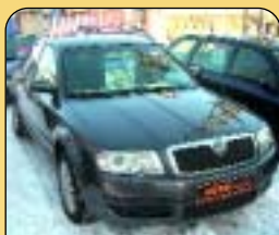
Škoda Superb 1.9 TDI, 96 kW, 1. maj., r. v. 2002, 129 tis. km, klima, 4x airbag, ASR, ABS, el. vybava, centrální a další. Cena: 437 000 Kč.