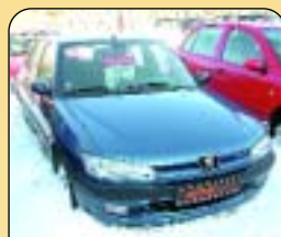
Peugeot 306 1.4 5 dvěř., r. v. 1997, 61 800 km, 2x airbag, orig. rádio, imobil., el. vybava, posil. říz., tažné, centrální. Cena: 126 000 Kč.