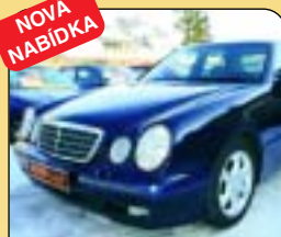
Mercedes-Benz E 270 Cdi, automat, 1. maj., r. v. 2001, 178 tis. km, klima, 6x airbag, ESP, ASR, ABS, CD, plná vybava, tempomat. Cena: 589 000 Kč.