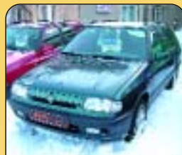
Škoda Felicia Combi GLX 1.9 D, 47 kW, r. v. 1997, 118 tis. km, centrální, imob., posil. říz., tažné. Cena: 109 000 Kč.