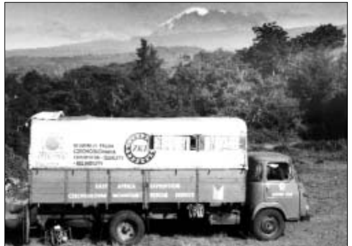
Kilimanjaro National Park, základní tábor Movange (1.108 m), v pozadí Kibo (hlavní vrchol Kilimanjara 5.895 m)