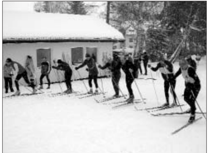
... a je odstartováno (kategorie muži B)

V pořadí sedmou disciplínou bude stolní tenis. U zelených stolů se sejdeme 5. března 2005, a to v tělocvičně na Národní ulici. Od 8.00 hodin proběhne turnaj mužů kategorie A a B, ve 13.00 hodin nastoupí kategorie žen A a B a mužů C. Přesný systém turnaje bude určen před jeho zahájením. Těšíme se na hojnou účast. Alena Jurášová