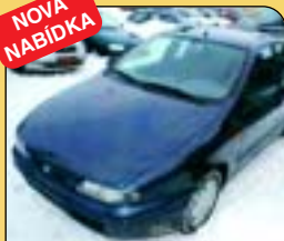
Fiat Brava 1.6 16V, 1. majitel, r. v. 1998, 102 400 km, rádio, imob., el. okna, posilovač řízení. Cena: 128 000 Kč.