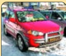
Honda HR - V 1.6 4x4, klima, 1. majitel, r. v. 2001, 2x airbag, ABS, CD + rádio, el. okna, tažné, centrální. Cena: 243 000 Kč + DPH.