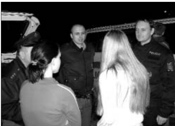
Policejní akce zaměřená na podávání alkoholických nápojů mladistvým

Dluhy na nájemném z nebytových prostor po lhůtě splatnosti eviduje Byterm u 31 nájemníka, dlužná částka představuje celkem 980 tis. Kč. JiKo