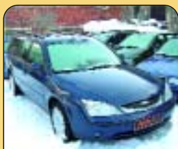
Ford Mondeo Combi 2.0 TDDi, klima, r. v. 2001, 109 tis. km, 8x airbag, ABS, CD, rádio, el. vybava, palub. poč., centrální a další. Cena: 299 000 Kč.