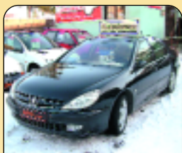
Peugeot 607 2.2 Hdí, 1. maj., r. v. 2001, 110 tis. km, aut. klima, 8x airbag, ESP, ASR, ABS, plná vyb., ind. park., senz. stěračů aj. Cena: 479 000 Kč.