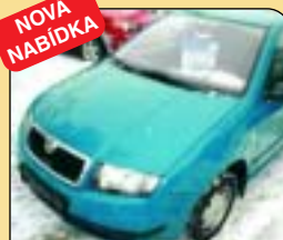
Škoda Fabia 1.0 Junior, 1. majitel, r. v. 2002, 44 150 km, airbag, rádio, imobilizér. Cena: 169 000 Kč.